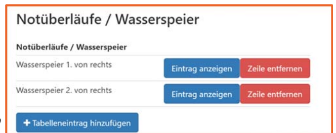
Abb.: „Tabelle“ in App